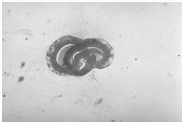
Figura 3. Triquina teñida con hematoxilina-eosina y obtenida por el método de compresión tisular y tinción 100x.